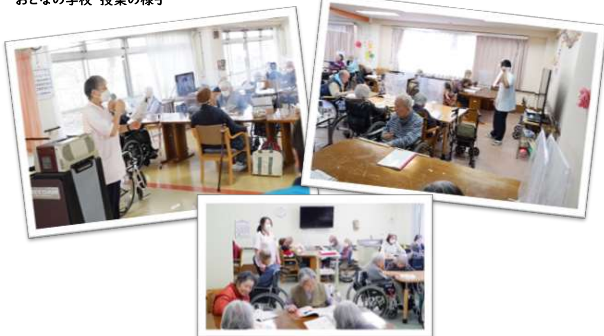
おとなの学校 授業の様子