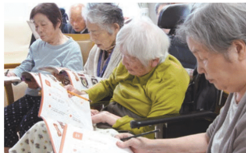
傾眠の傾向が強い方や徘徊の頻度が高い方も、授業形式のレクリエーションでは集中して取り組まれています。

「おとなの教科書」には、国語・算数・理科・社会など9科目と課外授業が用意され、話題が豊富。「教科書」という言葉は、難しいようにも聞こえますが、実際に授業形式のレクを受けてみると、皆様の思い出話を伺う内容となっているため、若かりしあの頃の